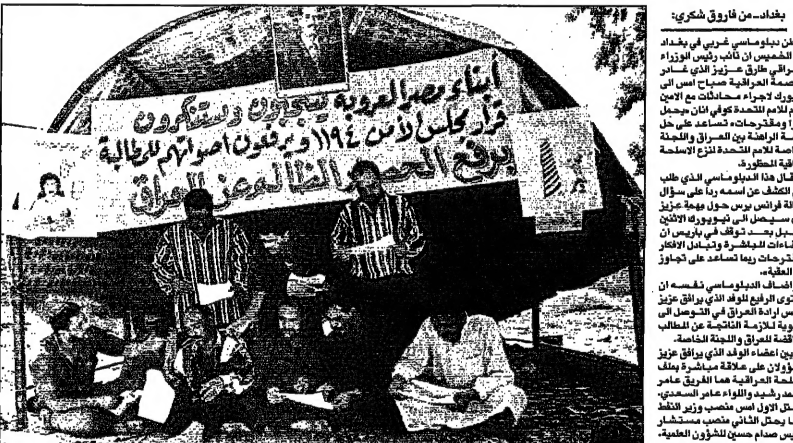
طارق عزيز يحمل مقترحات عراقية لحل الازمة مع اللجنة الخاصة

بغداد - من طارق شكري: اعان دبلوماسي عربي في بغداد... طارق عزيز يحمل مقترحات عراقية لحل الازمة مع اللجنة الخاصة